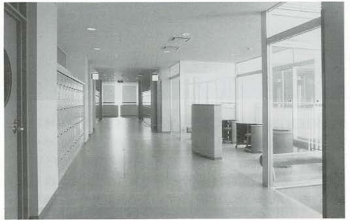
(新校舎内3F付近の写真)

OBの方々も多数来場されましたが、昨年まで併設されていた中学校の入試相談と案内は同じ3Fの別の教室で行われたた